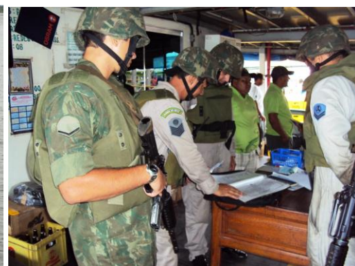
Atividade de Inspeção Naval nas embarcações regionais