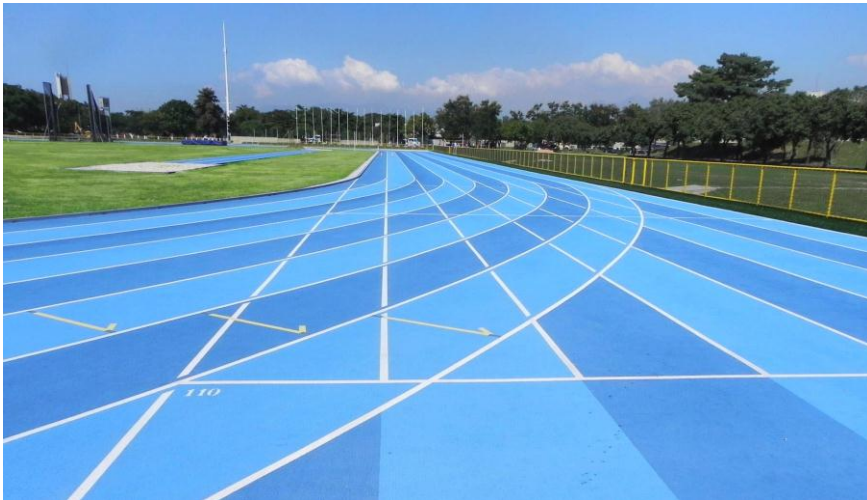
Pista de Atletismo

Esporte é vida...viva o esporte! ADSUMUS e VIVA A MARINHA!