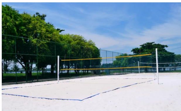
Quadra de Volei